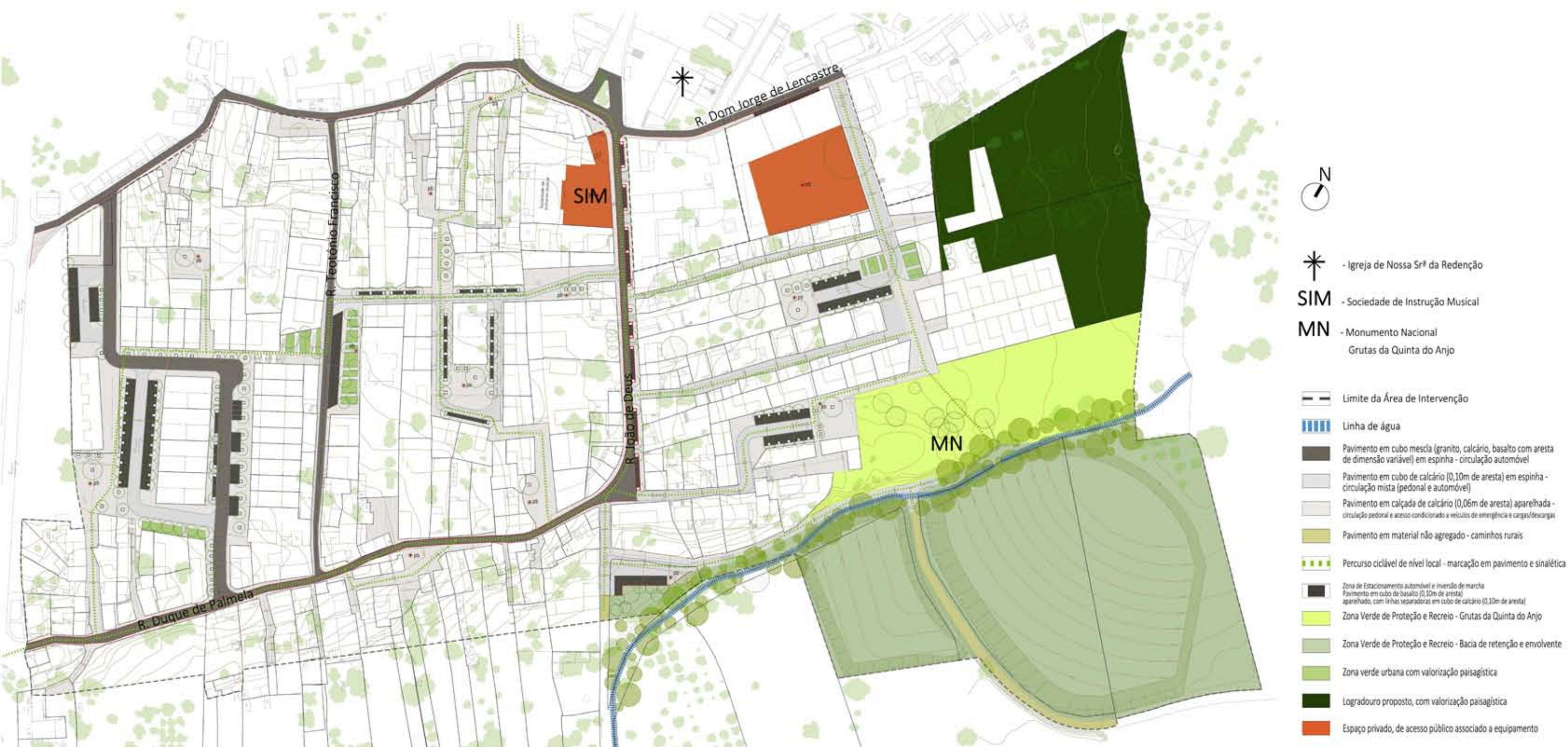
PLANTA DE ESPAÇOS EXTERIORES