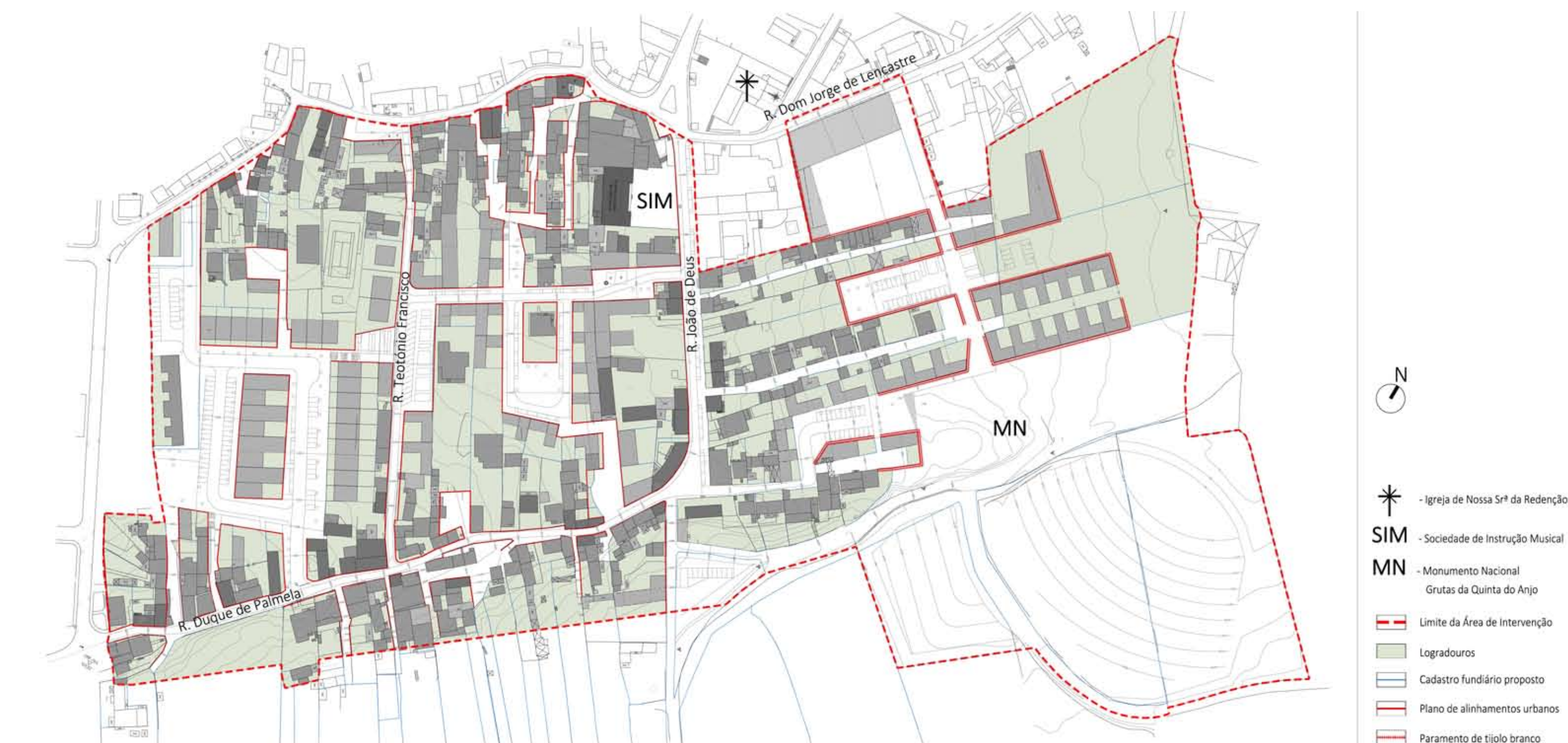
PLANO DE ALINHAMENTOS